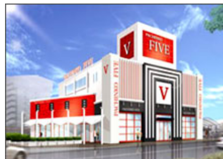
リニューアル提案